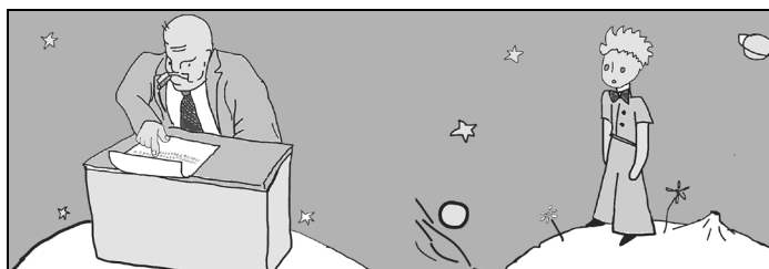
Figura 1 – Ilustração adaptada do livro “O Pequeno Príncipe”.

(...) Quando achas um diamante que não é de ninguém, ele é teu. Quando achas uma ilha que não é de ninguém, ela é tua. Quando tens uma ideia primeiro, tu a fazes registrar: ela é tua. E quanto a mim, eu possuo as estrelas, pois ninguém antes de mim teve a ideia de as possuir. Isso é verdade, disse o principezinho. E que fazes tu com elas? Eu as administro. Eu as conto e reconto, disse o homem de negócios. É difícil. Mas eu sou um homem sério! O principezinho ainda não estava satisfeito. Eu, se possuo um lenço, posso colocá-lo em torno do pescoço e levá-lo comigo. Se possuo uma flor, posso colher a flor e levá-la comigo. Mas tu não podes colher as estrelas. Não. Mas eu posso colocá-las no banco (Saint-Exupéry, 2015).