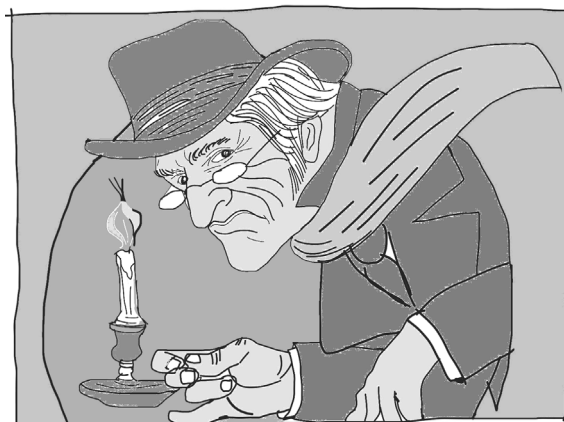
Figura 2 – Ilustração adaptada de Ebenezer Scrooge - Charles Dickens.

O encontro com o espírito do falecido amigo Marley e a consequente viagem ao passado, presente e futuro são uma segunda chance para o personagem principal. A metáfora utilizada possibilita a reflexão sobre nossas escolhas cotidianas. O tempo de que dispomos para aquilo que é importante em nossas vidas nada mais é do que uma abstração criada para ordenar os acontecimentos. E as festas de Natal são momentos para a reunião dos amigos e das famílias. Charles Dickens escreveu esse livro para quitar uma dívida. Motivado pela necessidade, o autor produziu um memorável conto natalino.