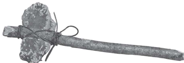
Figura 1.1 Martelo pré-histórico, feito de pedra e madeira.

Supõe-se que na pré-história, portanto, o homem tenha adaptado a pedra às suas necessidades, respeitando a anatomia da mão para tornar seu manuseio mais seguro e eficaz. Essa suposição se baseia no formato dos utensílios daquela época, como as ferramentas utilizadas para caça e defesa pessoal (Figura 1.1). De acordo com os elementos que deveriam ser trabalhados e com as características dos trabalhadores, era estabelecido um padrão (formato e dimensões) para as ferramentas, que também eram feitas utilizando madeira e ferro.