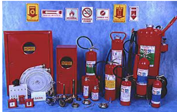
Combate a incêndio